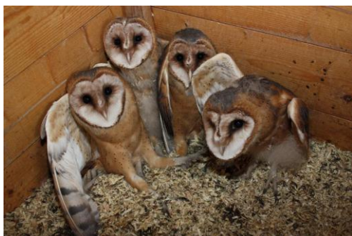
Opmerking : nestfotografie is in Vlaanderen bij wet verboden